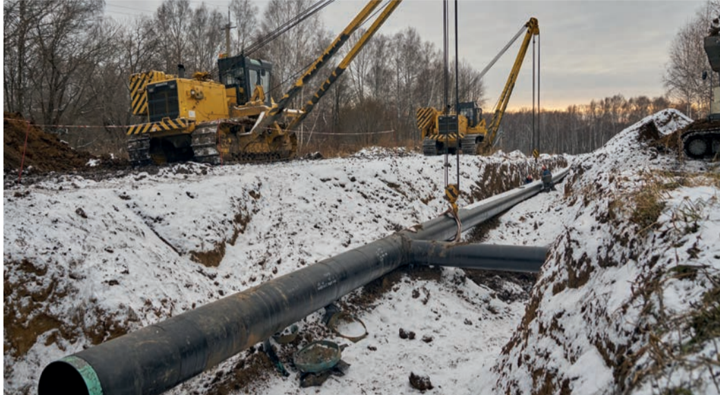
Капитальный ремонт участка магистрального газопровода Юрга – Новосибирск

– Огневые не делятся на сложные и простые. Простых не бывает. К сварочно-монтажным работам всегда следует относиться с предельной осторожностью и вниманием.