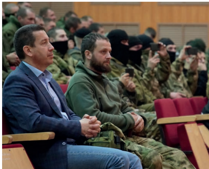
Концерт Государственного молодежного ансамбля песни и танца «Алтай» для мобилизованных в воинской части в Елани (Свердловская область)