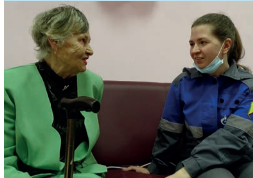
Газовики навестили пенсионеров

Каждый филиал поздравляет своих пенсионеров с Днем старшего поколения по-разному, но никто не оставляет их без внимания.