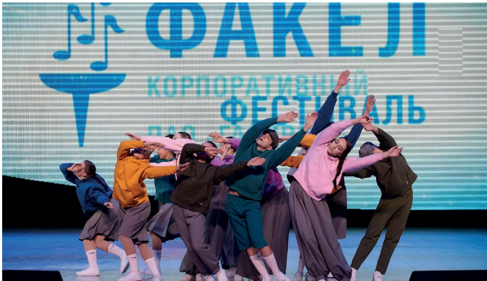
«Оранжевые коты» вновь удивили жюри динамичным и разноплановым танцем

– Ребята молодцы, выложились на все 100 процентов. Конечно, обрадовались, но бы-