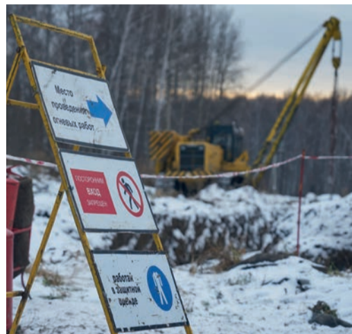
Первое правило огневых – неукоснительное соблюдение требований безопасности

Новосибирское ЛПУМГ обеспечивает надежную эксплуатацию 1016,77 км магистральных газопроводов, в том числе 25,1 км резервных ниток подводных переходов.