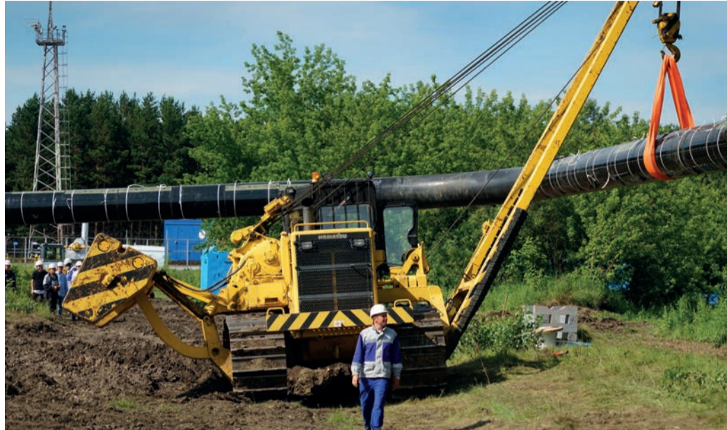
Специфика Новокузнецкого филиала – большое количество ремонтных работ в летний период

– Газопровод Парабель – Кузбасс, участок которого обслуживает Новокузнецкое ЛПУМГ, проложен в одну нитку. Такая производственная особенность в разы увеличивает груз ответственности – мы не можем подвести потреби-