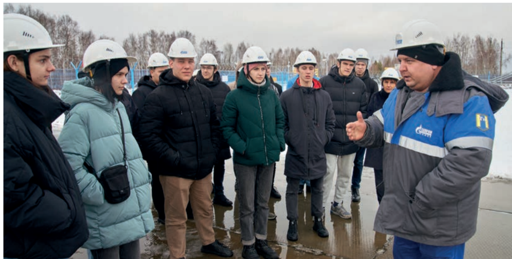
В экскурсии приняли участие 25 учеников Газпром-класса

15 ноября работники Володинской промплощадки Томского ЛПУМГ ООО «Газпром трансгаз Томск» провели экскурсию для учеников томского Газпром-класса лица при ТПУ.