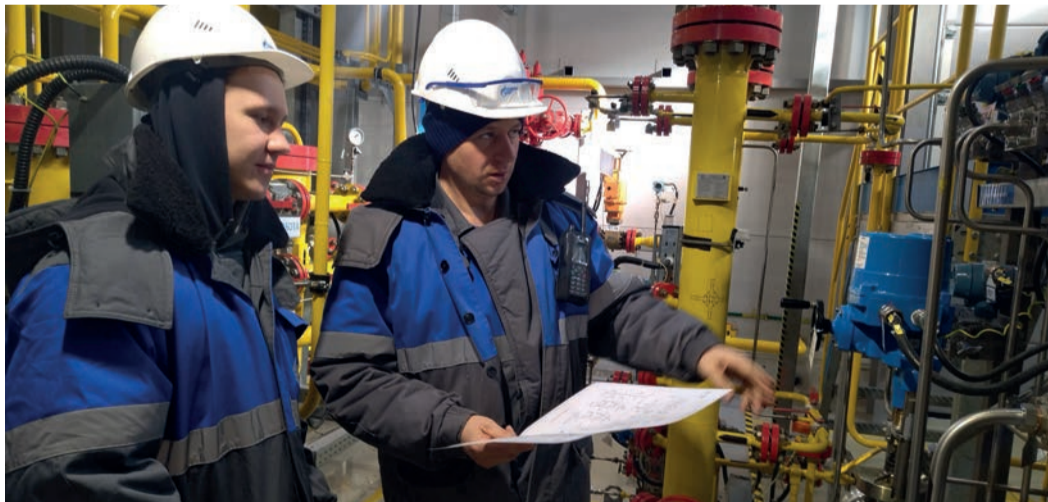
Работники КС «Атаманская» рассказали студентам из Волгограда об устройстве компрессорной станции

Четверо студентов третьего курса ЧПОУ «Газпром колледж Волгоград» прошли практику на объектах Свободненского ЛПУМГ ООО «Газпром трансгаз Томск».