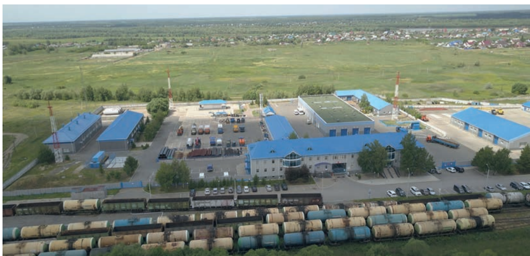
База Омского линейного производственного управления магистральных газопроводов ООО «Газпром трансгаз Томск»