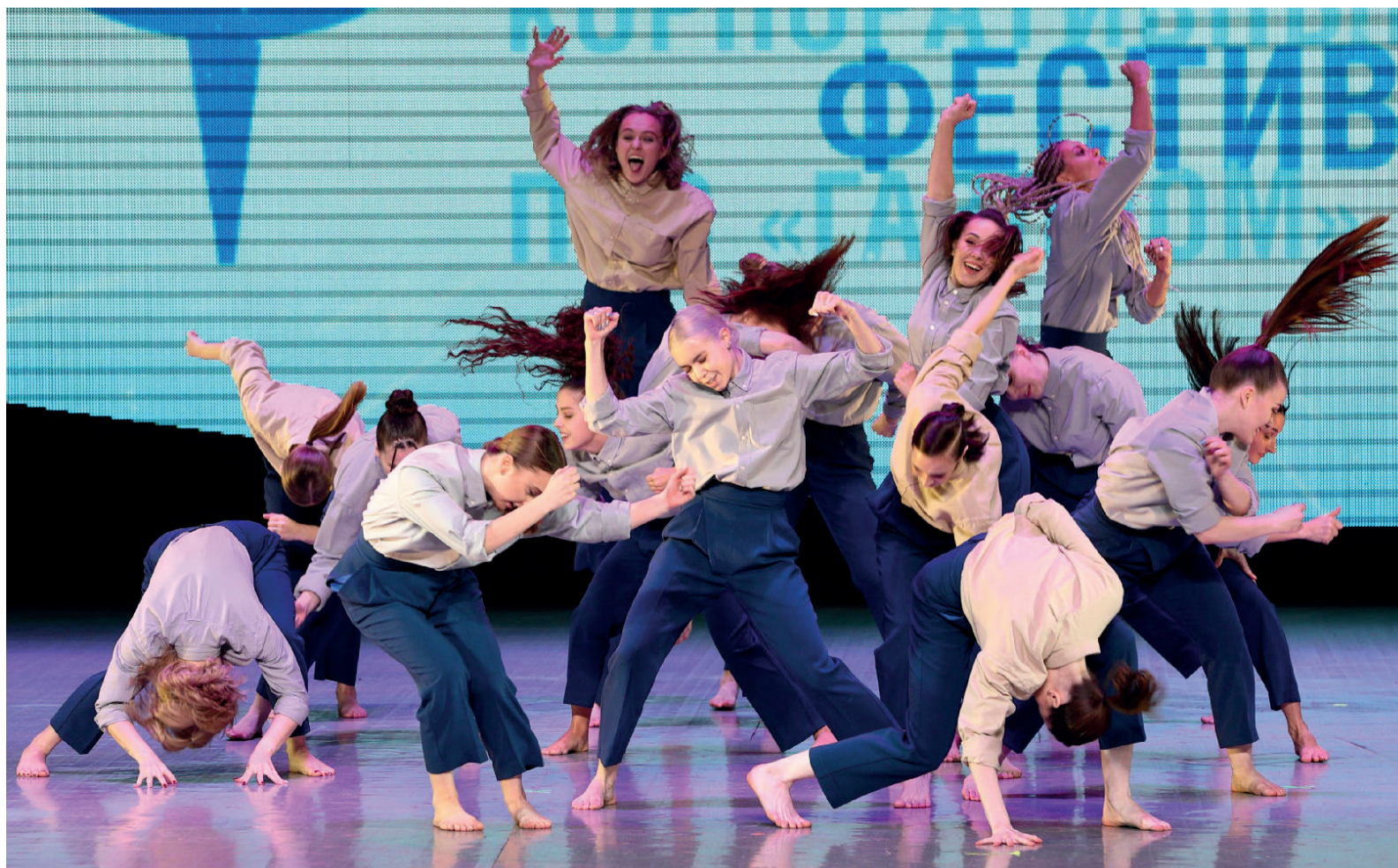
Шоу-балет «Вавилон» не разочаровал ожиданий зрителей

Артисты фестиваля «Факел» приняли участие в акции «Мы вместе», а также выступили на благотворительном концерте «Дети – детям».