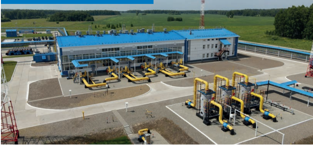
База Юргинского ЛПУМГ находится в восьми километрах от трассы около Просоково

Ежегодный объем поставки газа потребителям Юрги и Юргинского района составляет более 53 млн м 3 .