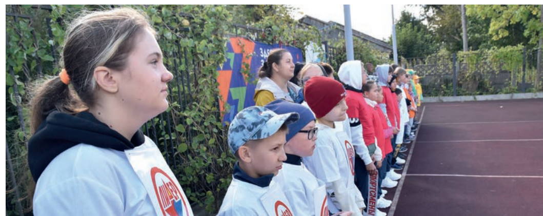
Участники олимпиады на общем построении