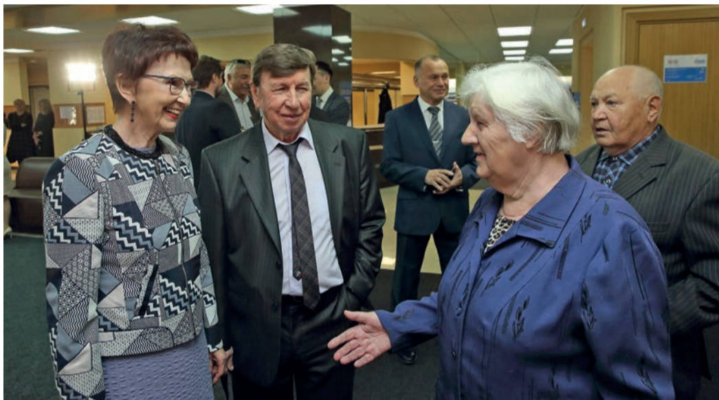
Радость встречи с бывшими коллегами

лей «Новые имена» и «Факел» «Музыка сердца», «Вавилон», «Радужка» и другие.