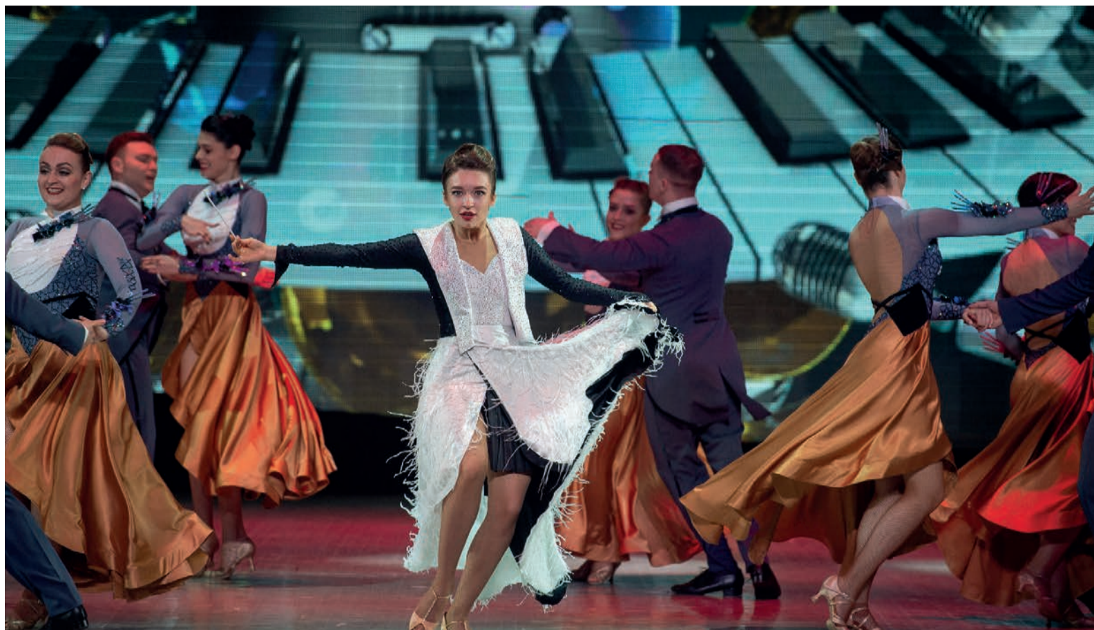
«Музыка сердца» устроила «турбулентность» на сцене