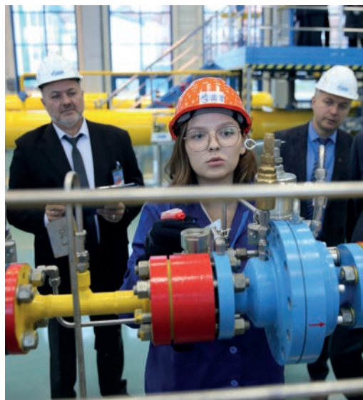
Студенты выполняли практические задания на учебном полигоне Корпоративного института