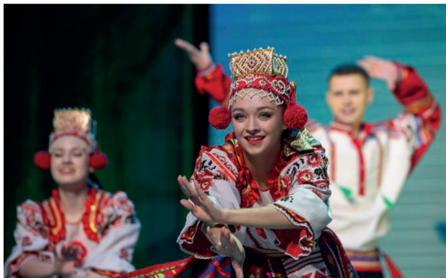
Выступление «Сибирского сувенира» сопровождали овации зала