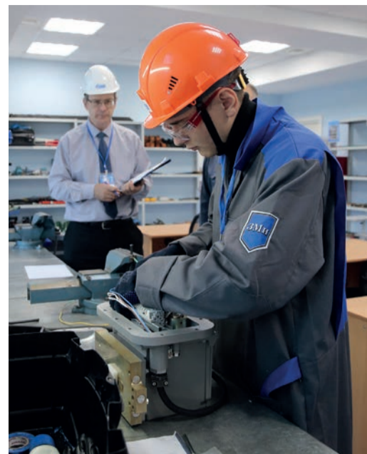
Конкурс «Лучший слесарь КИПиА»

В Корпоративном институте ООО «Газпром трансгаз Томск» состоялся конкурс профессионального мастерства среди студентов, которые проходили этим летом практику в филиалах компании.