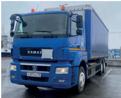
УТТусТ предоставило автомобили для доставки материально-технической помощи в воинские части

В Ленске газовики поддержали благотворительный концерт, собранные средства с ко-