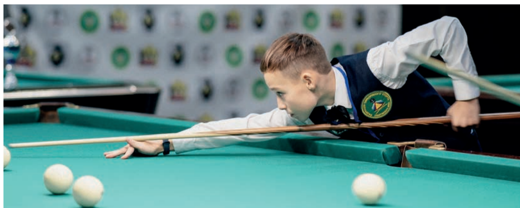
В соревнованиях приняли участие спортсмены в возрасте от 9 до 19 лет