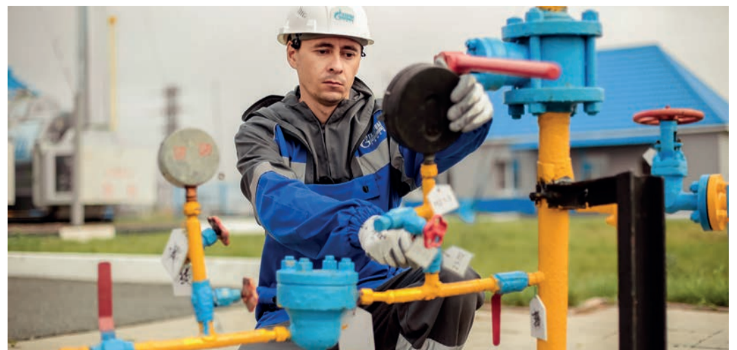
Работники филиала отвечают за эксплуатацию около 400 км газопровода от севера Тюменской области до Новосибирской области