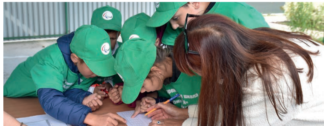
Некоторые ребята впервые увидели друг друга, однако смогли работать в одной команде

На Сахалине состоялась пятнадцатая областная спортивно-познавательная олимпиада для детей-инвалидов. Мероприятие собрало несколько десятков участников из разных районов области.