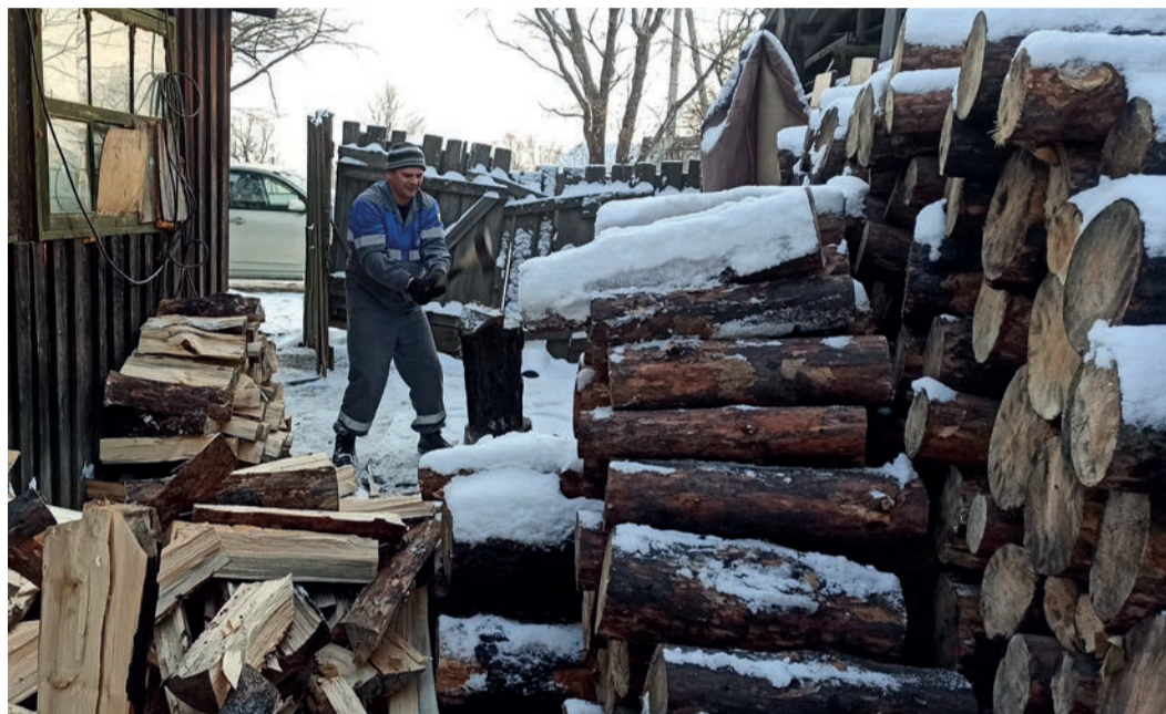
Работники филиалов компании помогают семьям мобилизованных заготовить дрова

Акция «Своим – помогаем», которая изначально предполагала разовый сбор средств на закупку всего необходимого для мобилизованных работников ООО «Газпром трансгаз Томск», переросла в большой волонтерский проект. Газовики поддерживают не только своих коллег, но и их семьи, а также всех, кто призван в Вооруженные силы РФ.