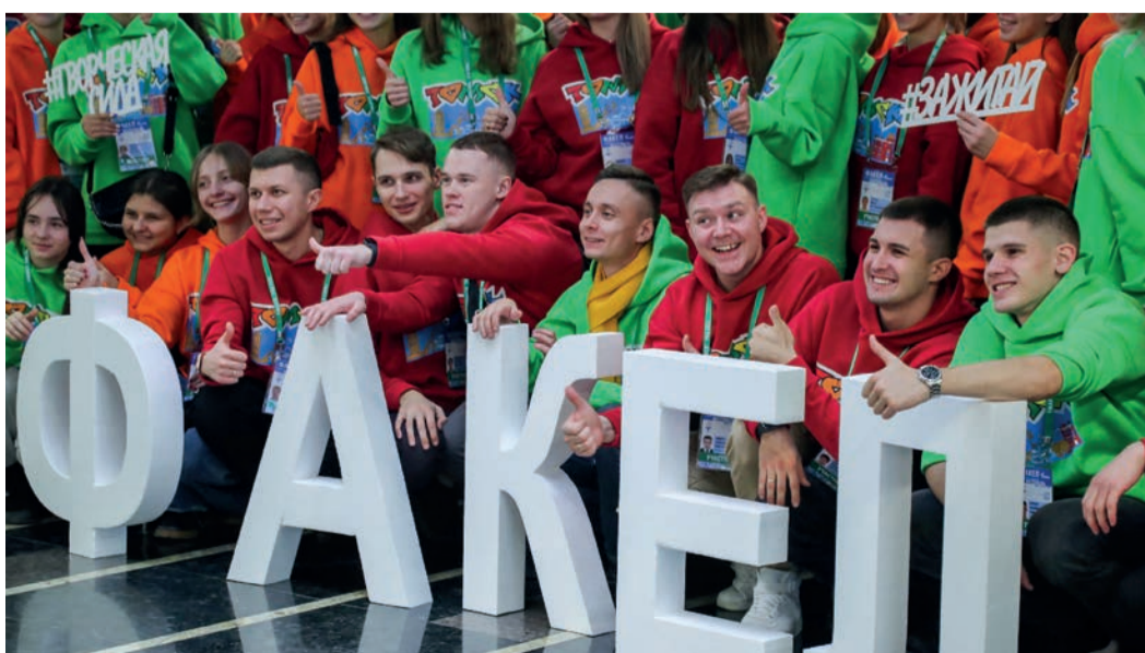
Команда ООО «Газпром трансгаз Томск»